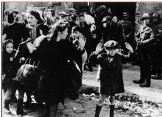
Arrestations dans le ghetto de Varsovie. Miraculeusement, l'enfant qui lève les bras au premier plan, survivra à tout cela.